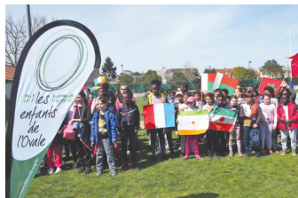
VIRY : les classes de CM2 et les EDO aux couleurs de tous les pays EDO pour un joyeux tournoi

PHILIPPE SELLA, PRÉSIDENT FONDATEUR : « Un bel et joyeux anniversaire à tous les enfants de l'ovale, de tous les pays ».