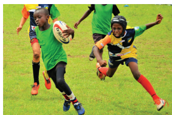
TBO CÔTE D'IVOIRE : sérieux et joueurs lors des tournois et enthousiastes pour le lâcher de ballons