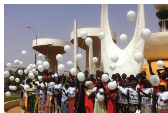
NIGER : un grand défilé et un magnifique lâcher de ballons à Niamey