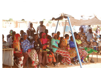
MALI : les enfants également très nombreux avec les familles ; à Viry, «l'équipe du Mali» d'une classe de CM2