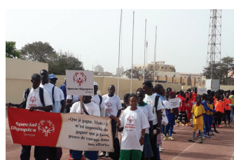
SENEGAL : festival de rugby et grand rassemblement au stade Ibar Mar Diop de Dakar