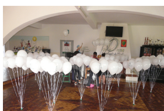
MADAGASCAR : un grand merci à tous les enfants et l'équipe des EDO Madagascar